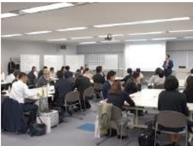
インバスケット活用術