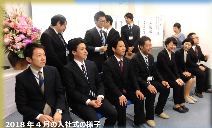
2018年4月の入社式の様子