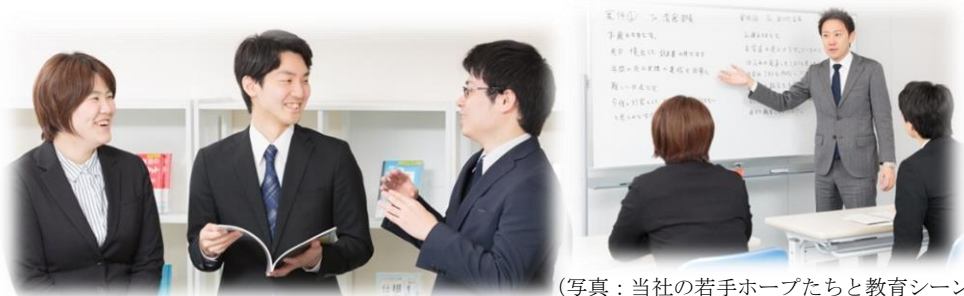
(写真：当社の若手ホープたちと教育シーン)